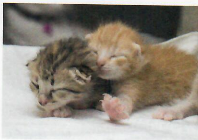
Katzen, 2 Tage