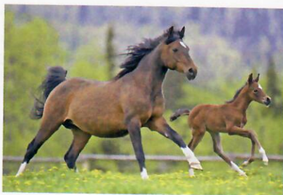
Fohlen, 5 Tage