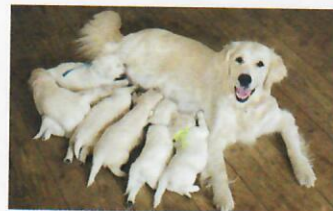
Welpen, 9 Tage