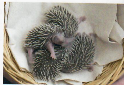
Igel, 4 Tage