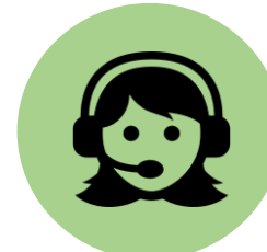
Aufgaben der Lehrkräfte